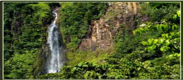
Les Chutes du carbet

Vous pouvez également découvrir les différents sites de l'Archipel :