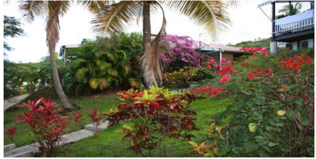
Plage & Bungalow Petite Anse